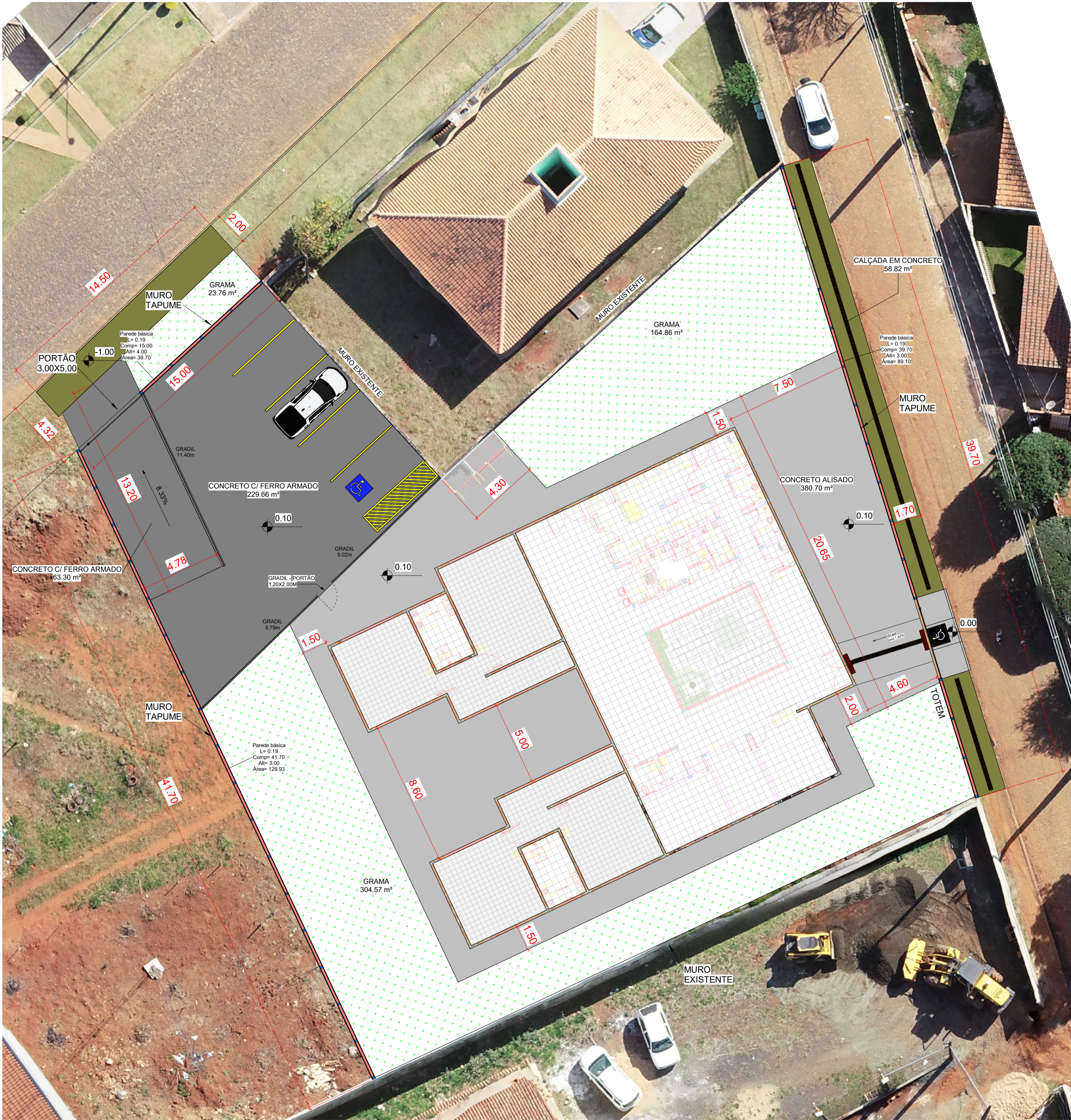
CALÇAMENTO 1 : 150